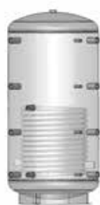
ACK 501R – 5001R