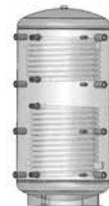
ACK 802R – 2002R