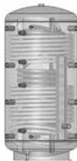
ACF 802R – 1502R