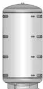
ACK 500 – 5000

* Le diamètre d'isolation ECO SKIN 100 mm faisant partie de nos livraisons standard passe à 200 mm! Le diamètre d'isolation optionnelle ECO SKIN 140 mm (uniquement pour nos modèles 800 - 1000 - 1500 litres de contenance ainsi que les accumulateurs ACK) passe à 280 mm!